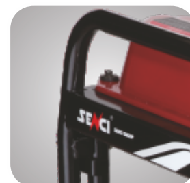
Cadru tratat pentru a preveni ruginirea